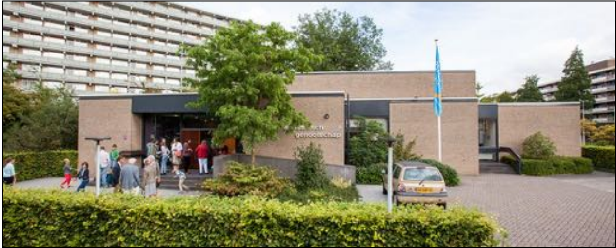
Het gebouw van het Apostolisch Genootschap in Zoetermeer