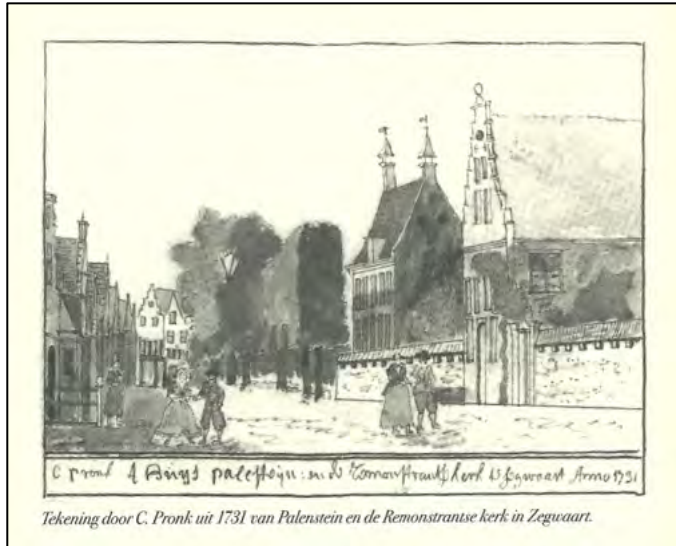
Tekening door C. Pronk uit 1731 van Palenstein en de Remonstrantse kerk in Zegwaart.

Op 1 oktober, in hetzelfde jaar 1787 waarin Van den Bosch de dood vond, wordt de remonstrantse kerk (deze stond naast kasteel Huis te Palenstein in de Dorpsstraat, zie afb. 2) geplunderd en alles kort en klein geslagen 1 . Ook de pastorie moet het ontgelden.