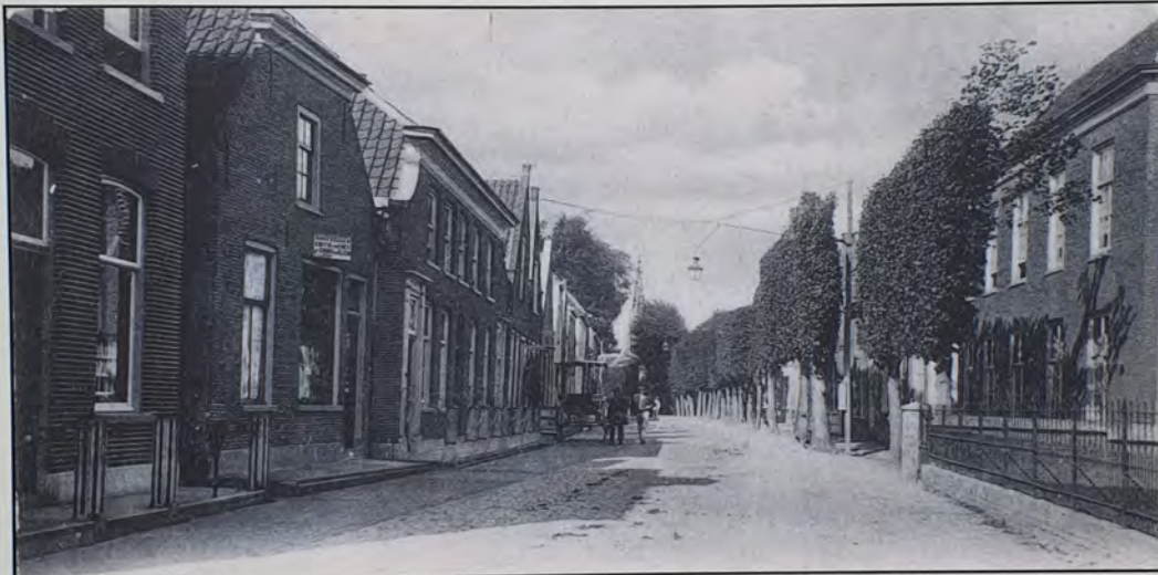
De Dorpsstraat in 1904.

De kerk was vanaf de Dorpsstraat niet te zien want hij stond achter de pastorie, een groot herenhuis van twee verdiepingen. Tijdens de strijd tussen de patriotten en prinsgezinden in 1787 is de kerk geplunderd en het interieur kort en klein geslagen. Het gebouw is toen verkleind en vanwege bouwvalligheid uiteindelijk in 1841 vervangen door een nieuw en kleiner kerkje. Dat was van steen met een pannendak en had boogramen aan de zijkant. De pastorie aan de kant van de Dorpsstraat is in 1856 gesloopt en vervangen door het huis rechts op de foto.