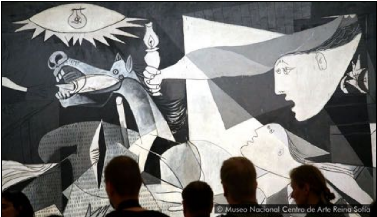
Pablo Picasso, Guernica (1937)

Laten we beginnen met een ogenschijnlijk eenvoudige vraag: Wie is of was Picasso? Een mens van vlees en bloed? Of is Picasso vooral het werk dat hij achterliet? Als je deze beroemde Spaanse kunstenaar wilt leren kennen, kun je een vuistdikke biografie over hem lezen. Je zou ook een bezoek kunnen brengen aan kasteel Vauvenargues waar hij begraven ligt. Het is echter maar de vraag of je zo de echte Picasso zult ervaren. Want is de kunstenaar niet veel meer dan zijn leven of zijn lichaam? In wezenlijke vorm is Picasso belichaamd in zijn werk. Zoals Guernica , een paneel uit 1937 waarin hij zijn angst voor het fascisme en de emoties bij het bombardement op die stad op heel eigen wijze vereeuwigde. Of Tête de femme uit 1962, waarin hij zijn tweede echtgenote op uiterst persoonlijke wijze portretteerde. Kortom, de diepste kern van een kunstenaar vinden we niet in zijn biografie of op zijn begraafplaats, maar in het werk dat hij ons naliet.