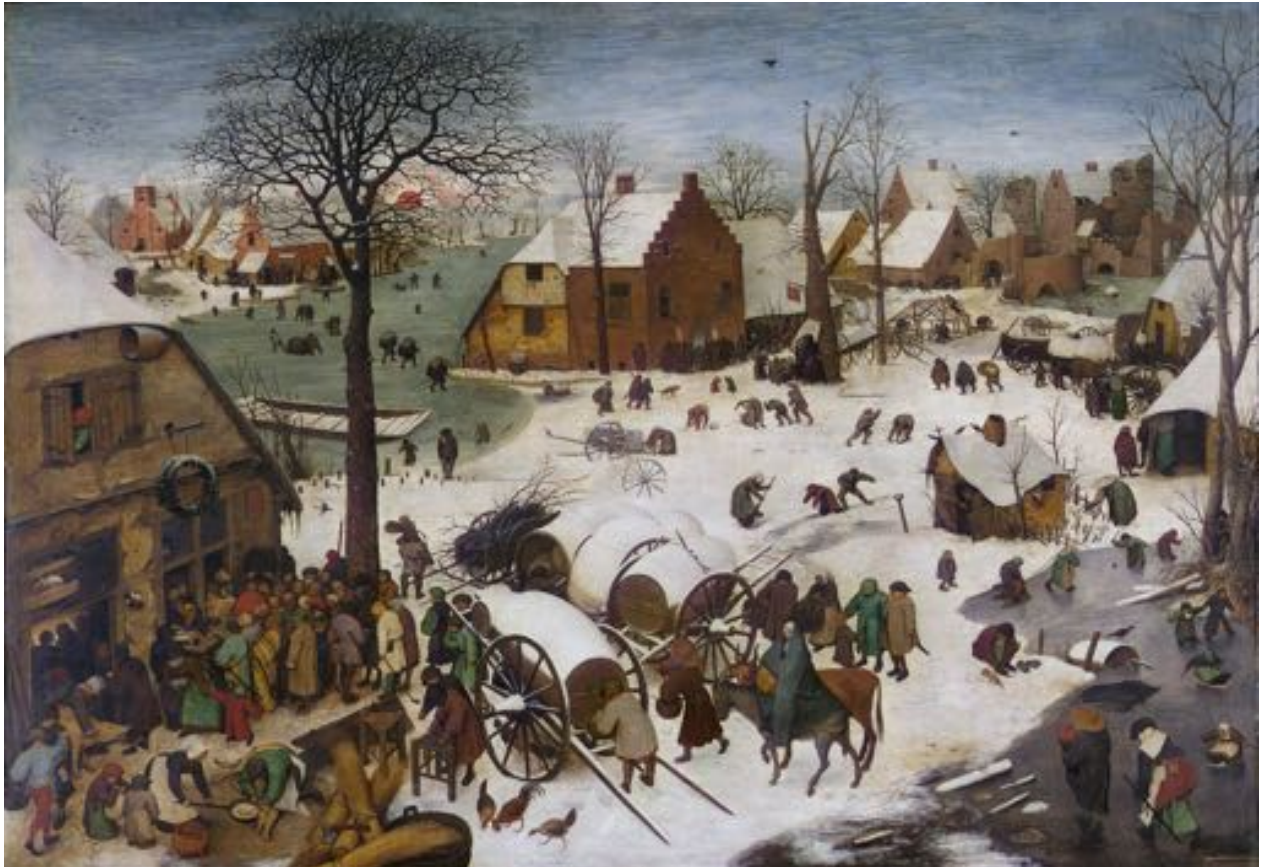
Pieter Bruegel de Oude, De volkstelling in Bethlehem (1566)